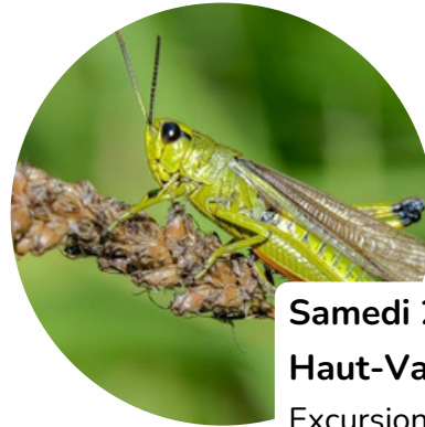
Samedi 26 juillet Haut-Valais Excursion espèces rares : orthoptères