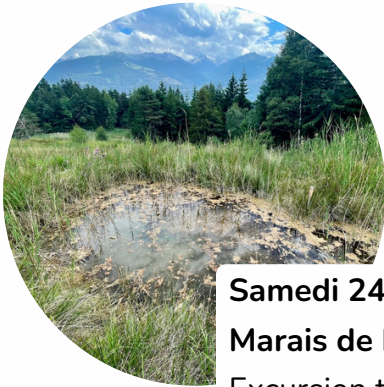
Samedi 24 mai Marais de Neinda, Savièse Excursion tout public Inscriptions sur : www.fetedelanature.ch