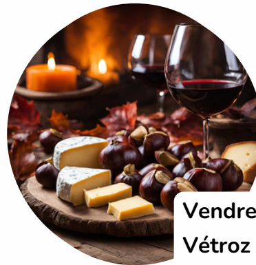
Vendredi 26 septembre Vétroz Bilan annuel et brisolée

Des circulaires avec les précisions de chaque activité et les détails d'inscription seront envoyées par e-mail en temps voulu et consultables sur notre site internet.