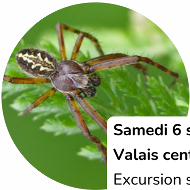
Samedi 6 septembre Valais central Excursion spéciale : araignées avec Pierre Loria